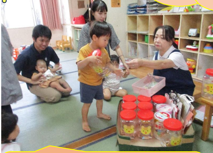
リスさんの箸入れ

スタッフ手作りの笹ステッキです。お母さま達から「えー、紙で笹を作ったのー！」(;'▽')と驚きの声が上がりました。